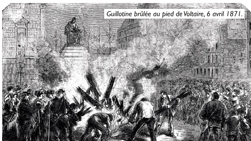
Guillotine brûlée au pied de Voltaire, 6 avril 1871.

Voilà ce que font les exploiters quand ils ont peur de perdre leurs privilèges. Ils sont prêts à tout.